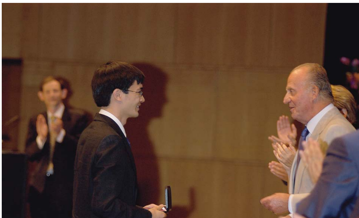
Tao recibiendo la Medalla Fields, Madrid 2006

Haciendo cálculos con rapidez y conociendo una gran cantidad de hechos es lo mismo que el escalador de roca con fuerza, rapidez y buenas herramientas. Aún así todavía necesitas un plan —que es la parte más difícil— y hay que ver el panorama completo.