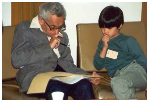
Terence Tao publicó en su cuenta de Google+ una foto. En ella se puede ver al gran Paul Erdős, con 72 años en aquel momento, y al propio Terence Tao con 10 añitos (la foto es de 1985)

—Hi Tao. What happiness to return to meeting!! —dijo Graham emocionado.