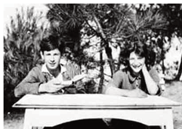
André Weil y su hermana Simone en Knokke leZoute, Bélgica, verano de 1922

—Seguro que hay muchas cosas más interesantes en las que gastar el tiempo de los alumnos.