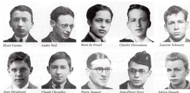
El grupo «Bourbaki» de matemáticos

Un ejemplo curioso de esta nueva simbología es el símbolo de «curva peligrosa» usado por el grupo para señalar pasajes especialmente difíciles en la lectura. Otro de los estilos del grupo Bourbaki que se han impuesto es la inclusión de ejercicios y notas históricas al final de cada capítulo.