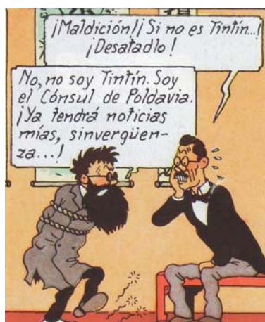
El Loto Azul. Tintín

—Todo comenzó con una broma. Recordamos una novatada de l'École donde se recibió a los nuevos alumnos con una exposición estrambótica por parte de un falso profesor que concluía