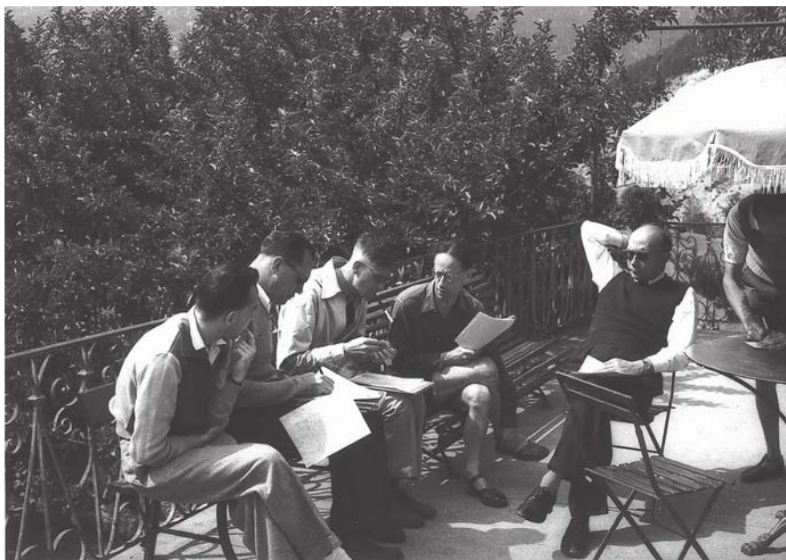
Reunión de trabajo del grupo Bourbaki con Weil sentado al fondo del banco

—No, de hecho lo más probable es que la ecuación A^N + B^N = C^N no tenga solución para N \geq 3 si A , B y C son números enteros.