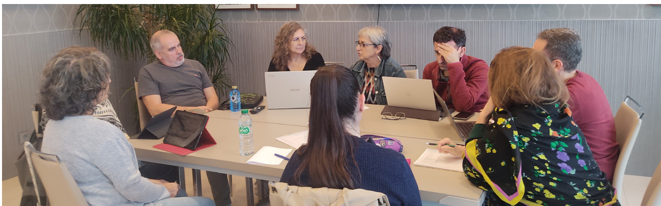
Figura 4. En el grupo de trabajo de Infantil y Primaria