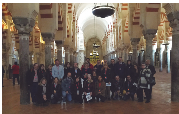
Figura 2. El grupo en la Alhambra

En cuanto a quién diseña los paseos, además del profesorado, podemos proponer que sean los propios alumnos y alumnas quienes diseñen las actividades, y también que sean los responsables de llevarlo a cabo. Por ejemplo, alumnado de un curso superior que hacen el paseo a sus compañeros de un curso inferior. El grado de implicación del profesorado en el desarrollo de este tipo de rutas es variable pero, como mínimo, su labor será la de tutelar que todo se lleve a cabo adecuadamente.