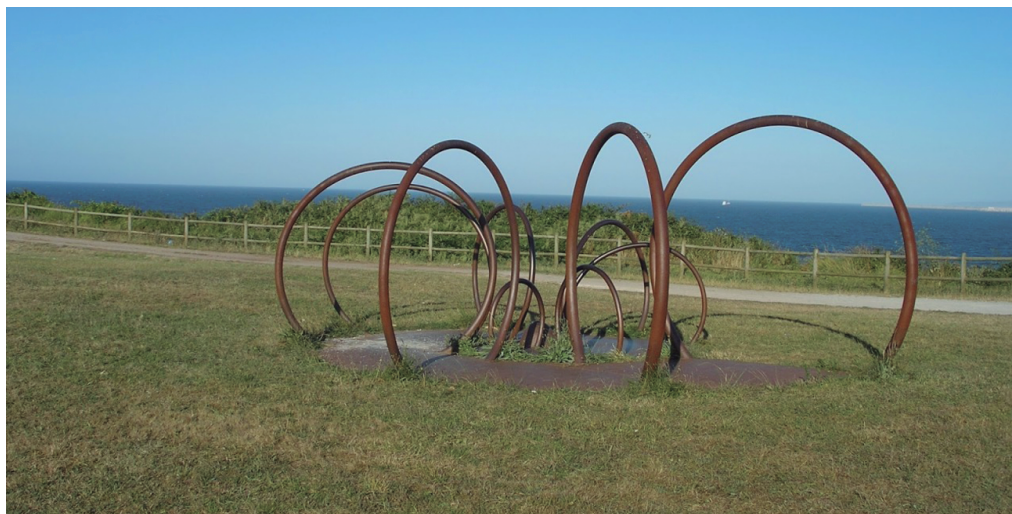
Figura 8. Un conjunto escultórico