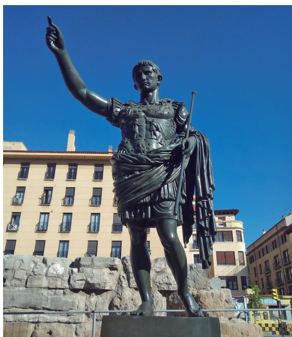
Figura 5. La estatua de Caesar Augusto