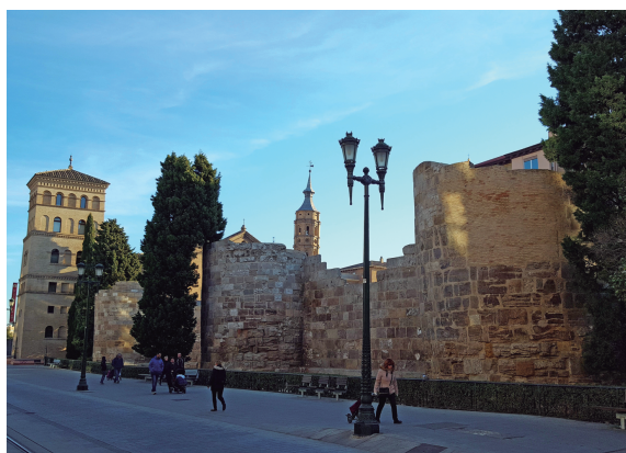
Figura 4. La muralla de Zaragoza