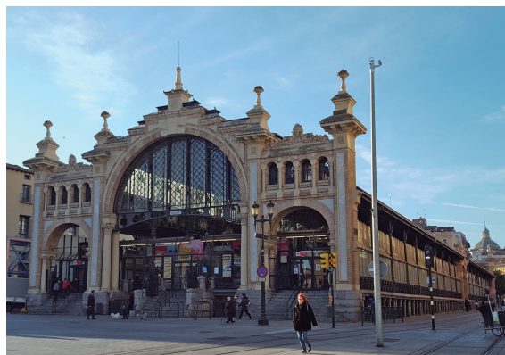
Figura 6. Mercado Central de Zaragoza