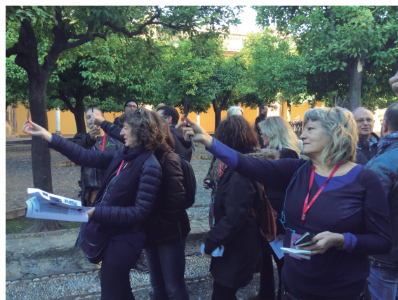
Figura 3. Medidas en la calle